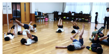
ある日の子どもたち