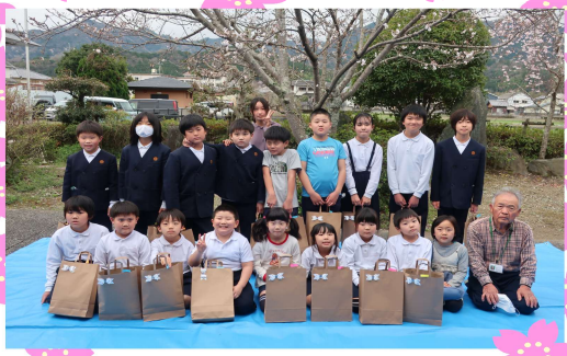
桜とみんなでパチリ!!

床の上に数字シートを広げ、6色のコマを投げて乗った数字で勝ち負けを競います。たくさんの友だちと室内で、静かにできるゲームです。お別れ会で早速楽しみましたよ。